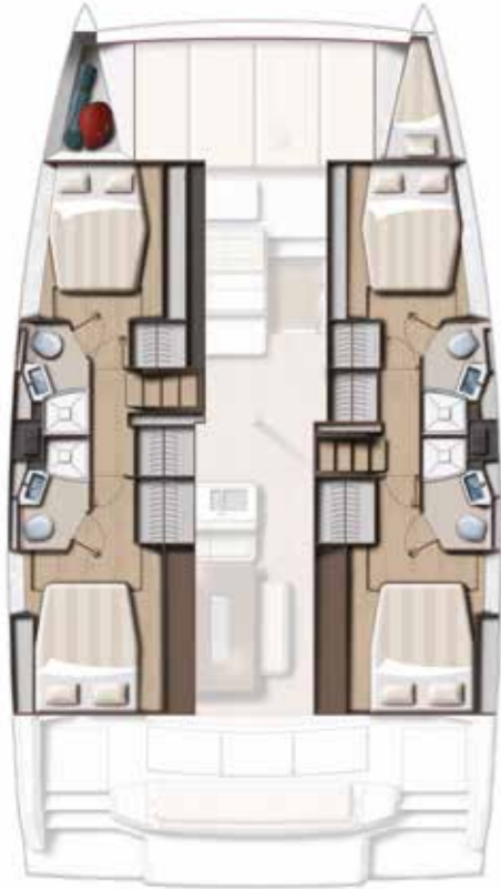
4 DOUBLE CABINS / 4 BATHS VERSION Version 4 cabines doubles / 4 sdb