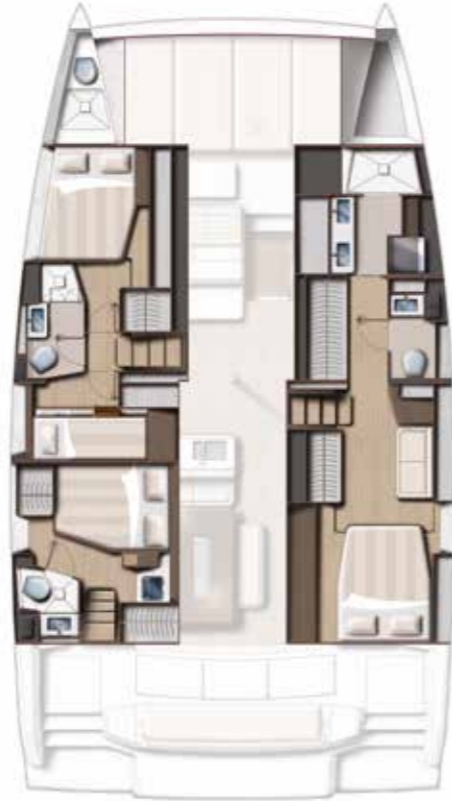
4 CABINS (OWNER) / 3 BATHS VERSION Version 4 cabines / 3 sdb (coque propriétaire)