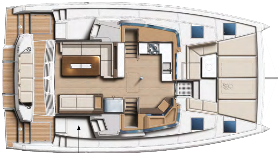
Club Armchairs in Pack Elegance instead of meridiene