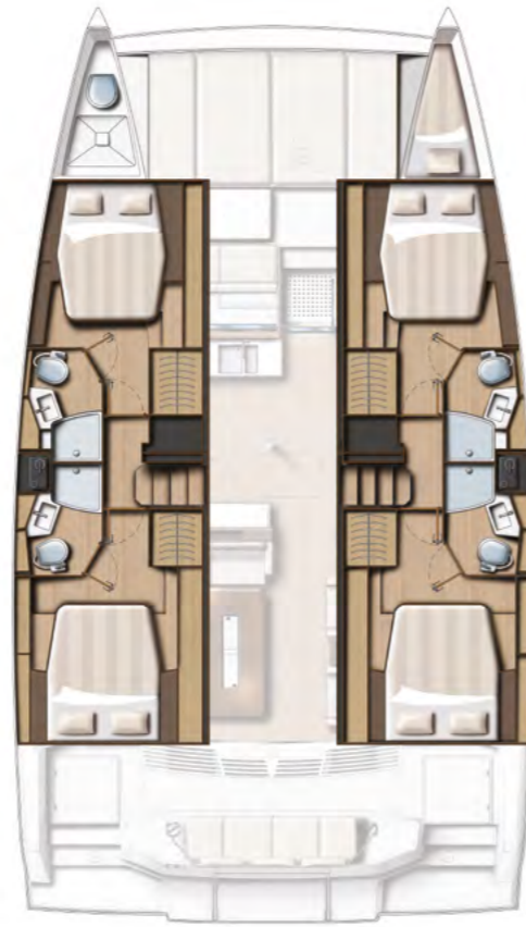
4 CABIN VERSION / 4 BATHS