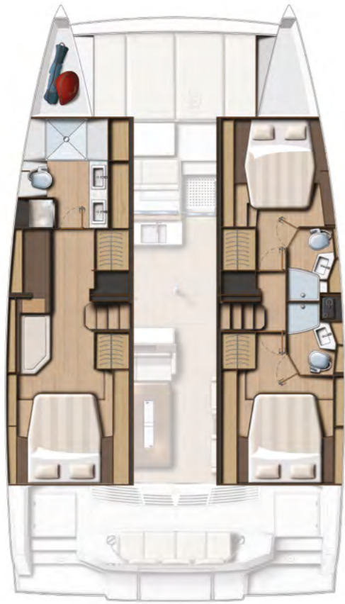
3 CABIN VERSION / 3 BATHS